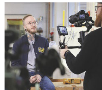
/ Das Branchenfernsehen Ligna.TV bringt aktuelle News ins Internet.

vorgelegt und dann die Sichtweise des Handwerks mit Praxisbeispielen und Meinungen von Holzhandwerkern untermauert. Schließlich werden Lösungen gezeigt und wo diese auf der Ligna zu finden sind. Beim Reportageformat „Vor Ort“ schauen die Moderatoren hinter die Kulissen und stellen in jeder der geplanten 20 Folgen einen Tischler/Schreiner in seinem Betrieb vor. Dabei kann es sich um ausgefallene Produkte, moderne oder unkonventionelle Fertigungsprozesse, aber auch um eine außergewöhnliche Firmengeschichte handeln. Wer etwas tiefer in die behandelten Themen einsteigen will, findet im Format „Im Fokus“ längere Interviews zum Thema sowie weiterführende Informationen zu bestimmten Sachverhalten. (bs)