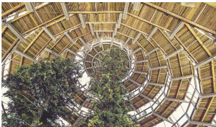
! Aktuelle Themen stehen auf dem Programm der Holzschutztagung in Dresden.

Aktuelle Themen aus den Bereichen Wirtschaft, Normung und Wissenschaft bietet die Deutsche Holzschutztagung am 4. bis 5. April 2019 in Dresden. Die Tagung, organisiert vom Institut für Holztechnologie Dresden (IHD), rich-