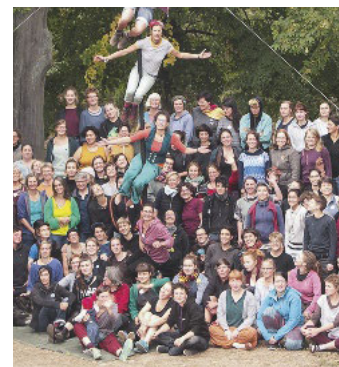
! 29. Tischlerinnentreffen auf dem Rittergut Lützensömmern 2018.

trotzdem genug Raum für Networking gelassen. Auch in den Gesprächsrunden gab es eine große Bandbreite an Themen: Es ging um einen Austausch für langjährige Selbstständige, Perspektiven nach der Ausbildung, neue Medien für die Auftragsakquise oder den Umgang mit rassistischen Kommentaren. Neben der Auseinandersetzung mit dem Arbeitsalltag von Tischlerinnen gab es auch ein Unterhaltungsprogramm. (ra) www.tischlerinnen.de