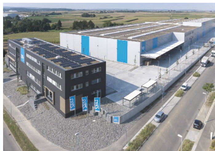
2016 ist der neue Stammsitz der ZEG in Kornwestheim eröffnet worden. Die Genossenschaft ist deutschlandweit aktiv.

Mit über 4200 Mitgliedern ist die ZEG Deutschlands größte Genossenschaft im Holzhandwerk. 890 Mitarbeiter in zwölf Niederlassungen informieren und beraten zu einem umfangreichen Sortiment und neuen Produkten. Rund 80 Außendienstler sorgen für eine intensive Betreuung vor Ort und über 95 Lkws für die termingerechte Lieferung innerhalb von 48 Stunden. (ra) www.zeg-holz.de